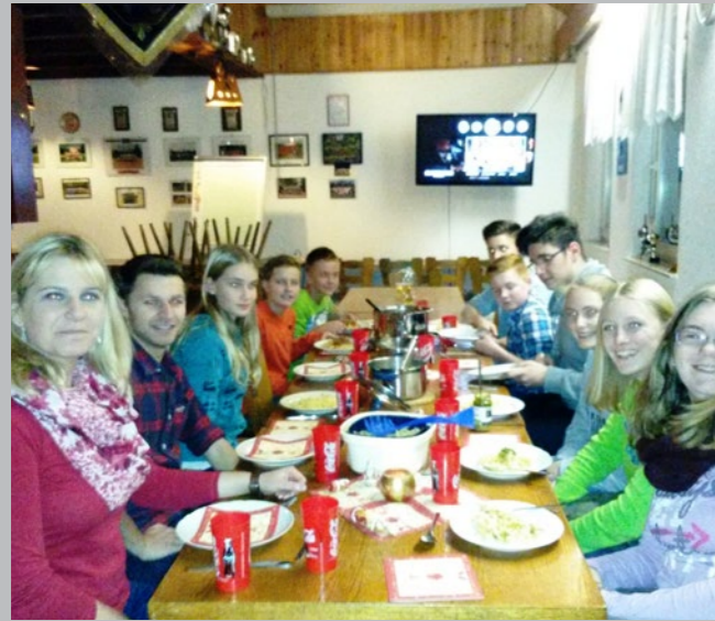
Kochen und Chillen im Vereinsheim