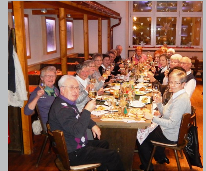
Tradition - die Weihnachtsfeier der Seniorenfitness