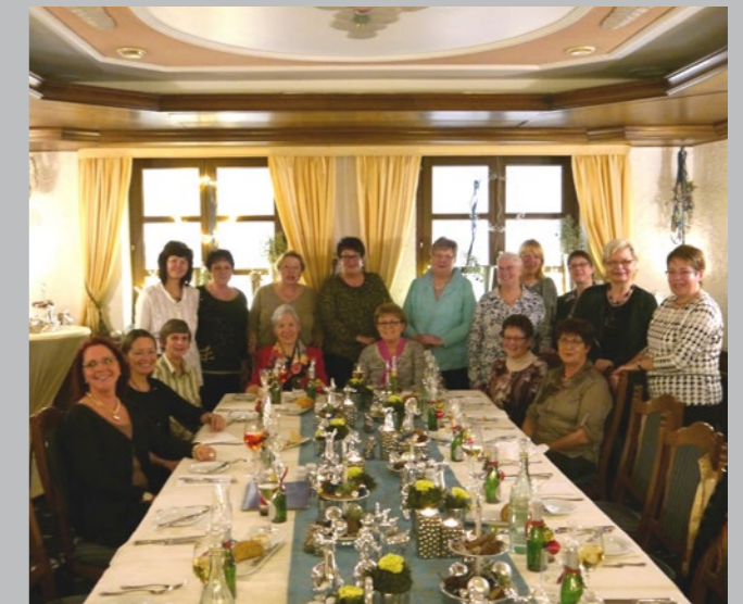
Weihnachtsfeier der Montagsfrauen