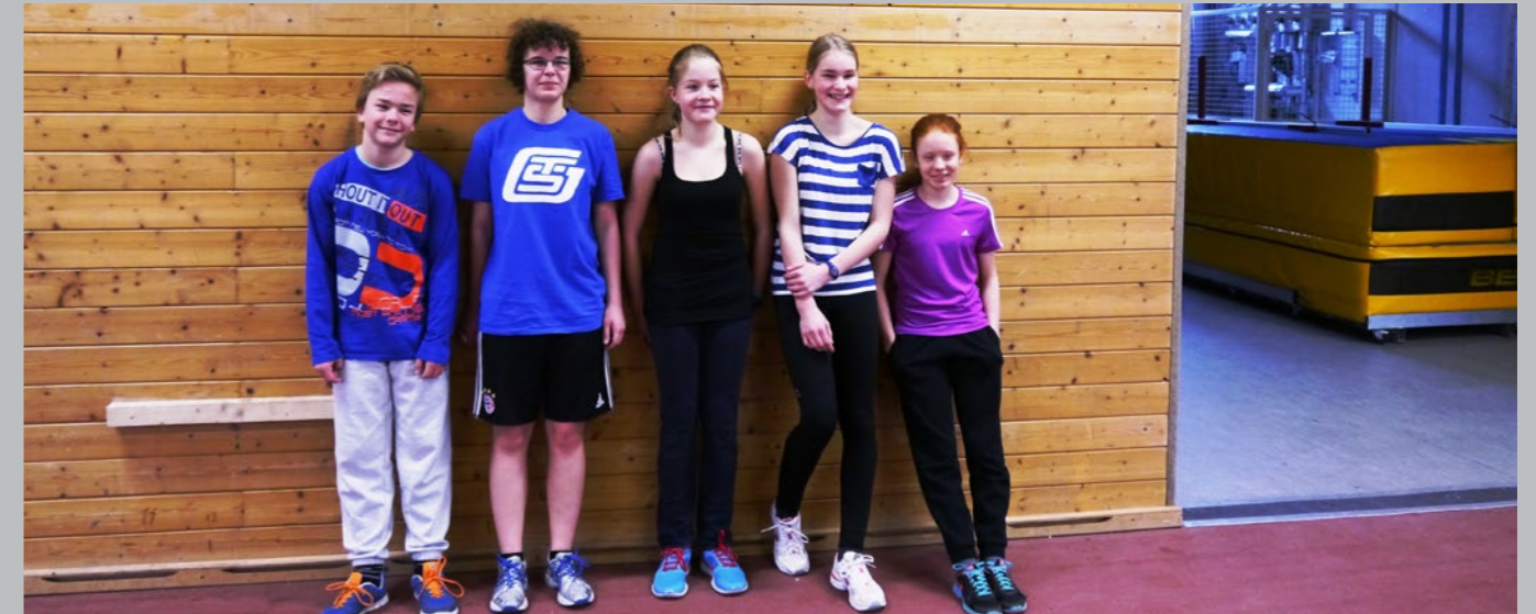
Team der TSG bei den Hallenwettkämpfen