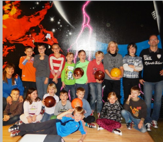
Fun beim Bowlen