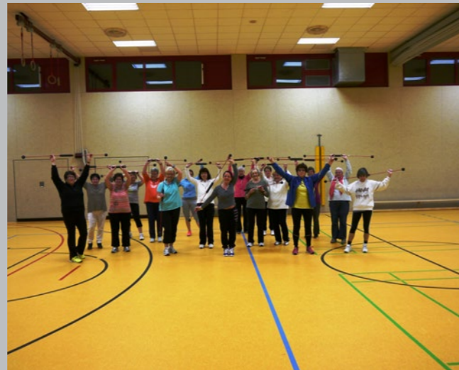
Fitness ab 50