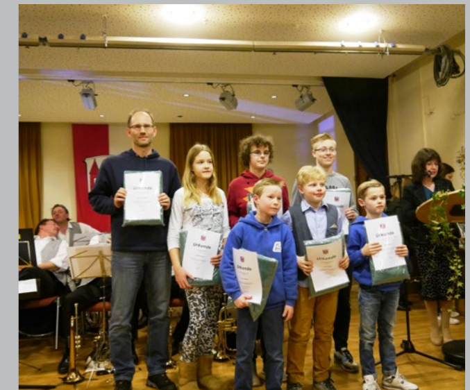
Ehrungen an unsere Sportler und Sportlerinnen