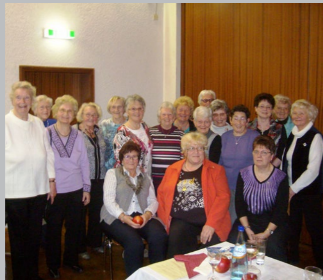
Ein Hauch von Wehmut...