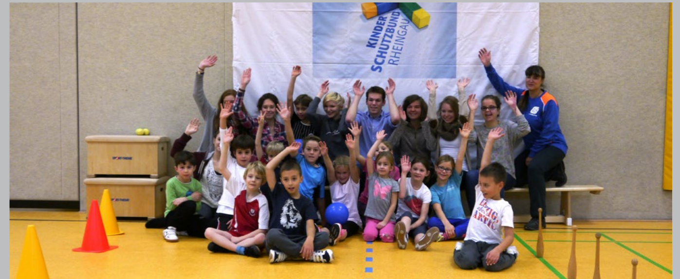
Spiele-Nachmittag des Kinderschutzbundes mit Unterstützung der TSG