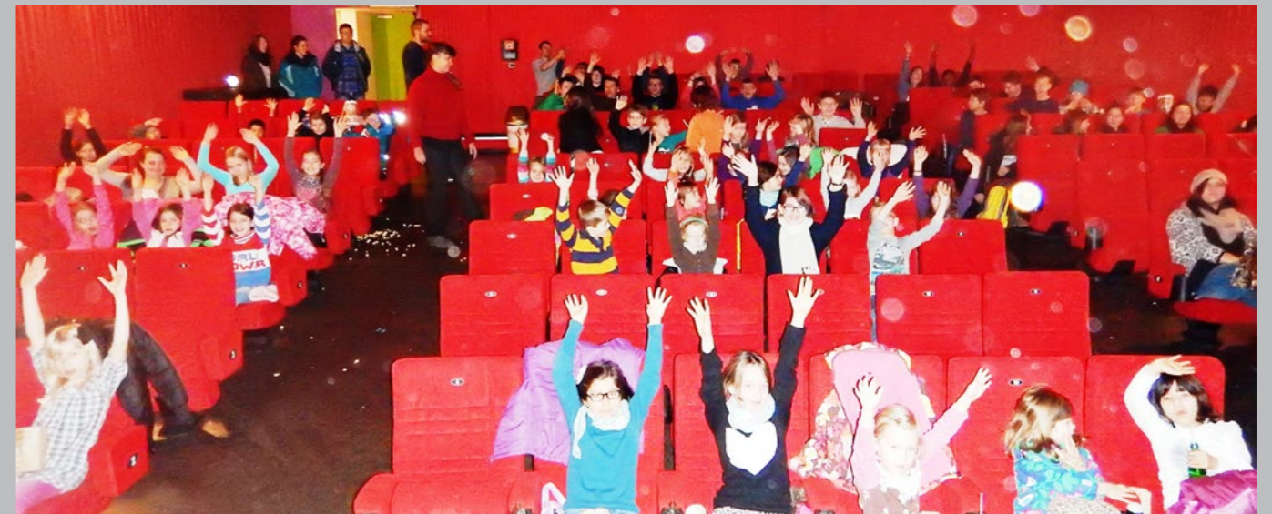
Der Weihnachtsmann der TSG brachte den Kindern den Film „Paddington“ ins Kino