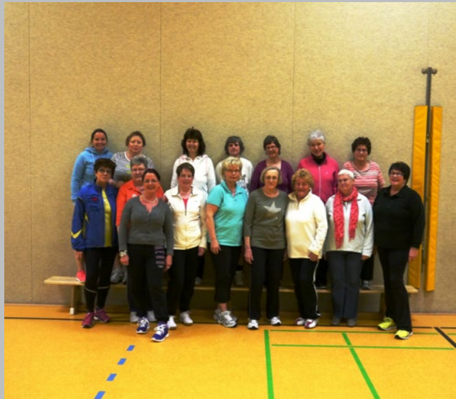
Montagsfrauen jetzt Mittwochs