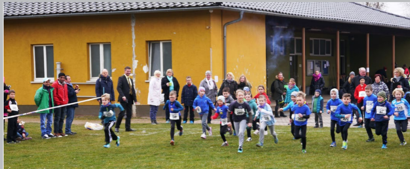
Auf die Plätze fertig los!