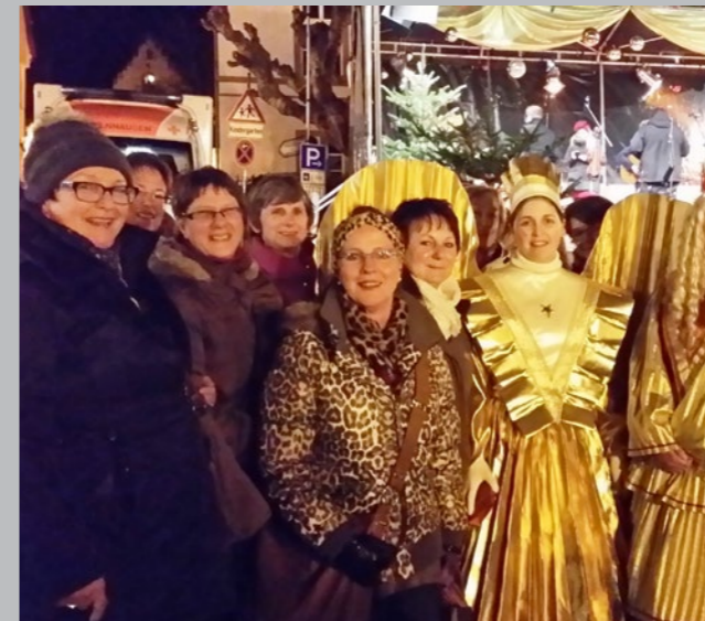
Weihnachtsengel in Gelnhausen