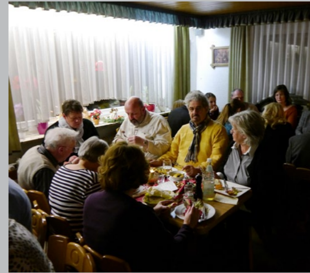
Lockeres Zusammensein der „Herzis“ zu Weihnachten