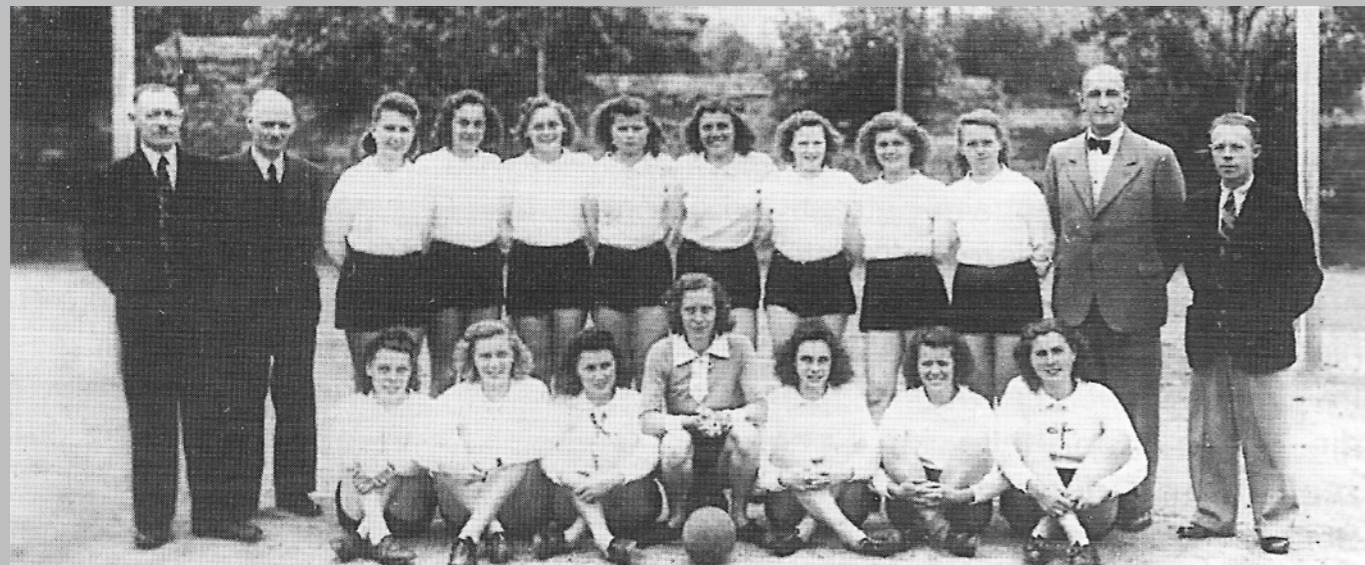
Die erste Handballmannschaft der TSG