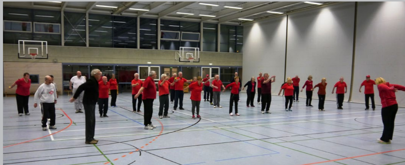
Abschlusstraining der Wintersaison 2014/15