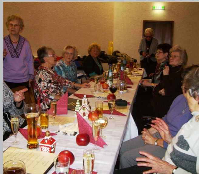
Weihnachtsfeier der Mittwochsfrauen