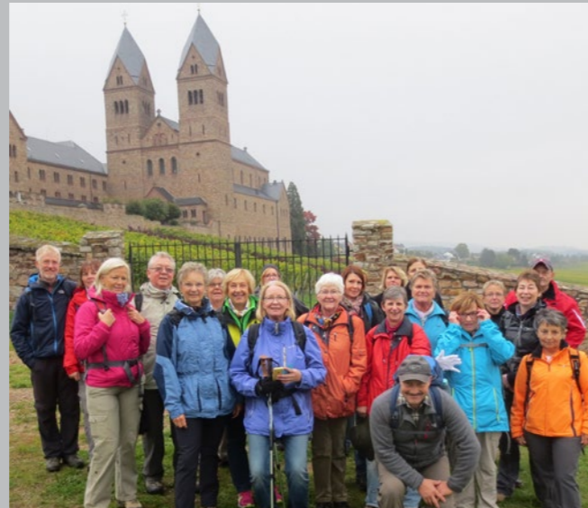
Herbstliche Wanderung vor dem Kloster Hildegard