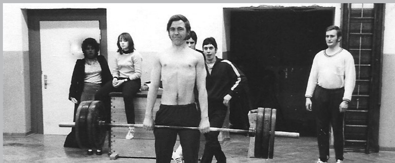
Ehemalige Fitnessgruppe der TSG