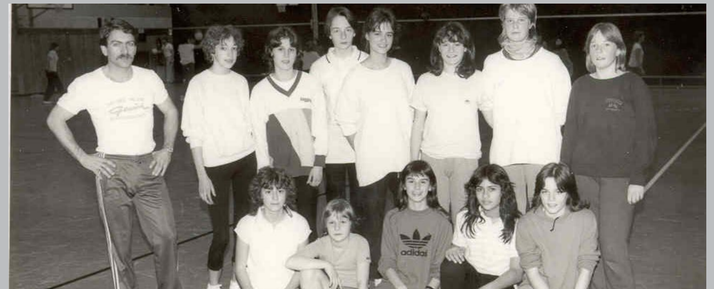
Leichtathleten der TSG vor einigen Jahren