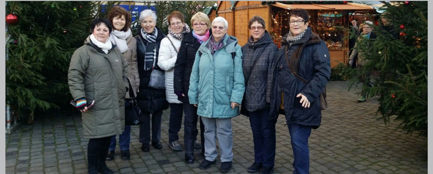
Mittwochsfrauen in Münster