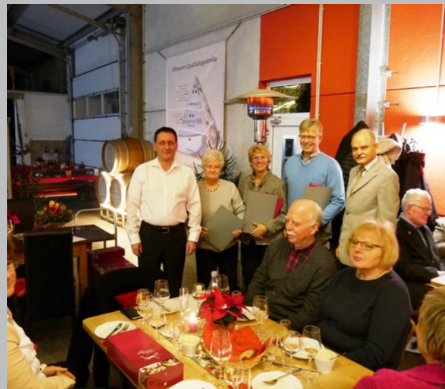
50 Jahre Mitgliedschaft