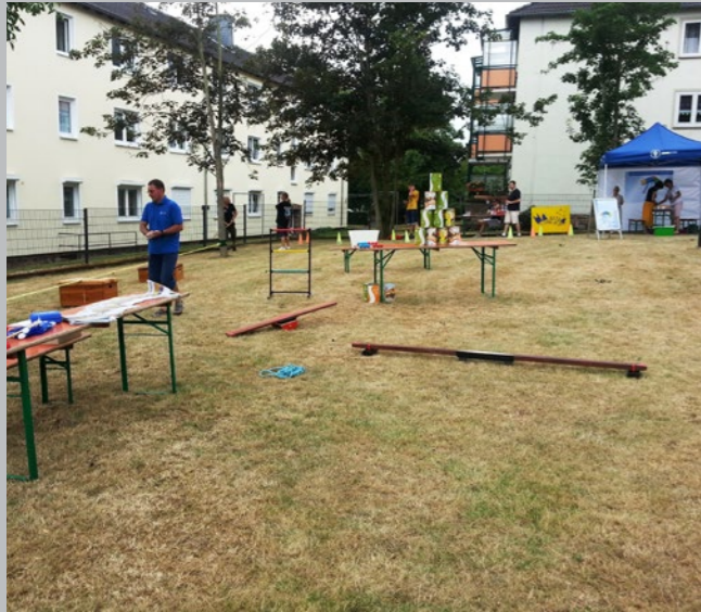
Lindiade mit verschiedenen Parcours