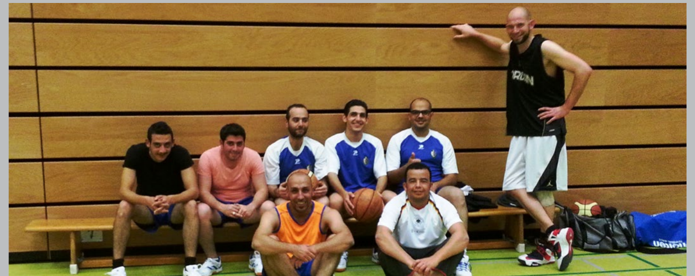
Syrische Basketballer bei der TS Geisenheim