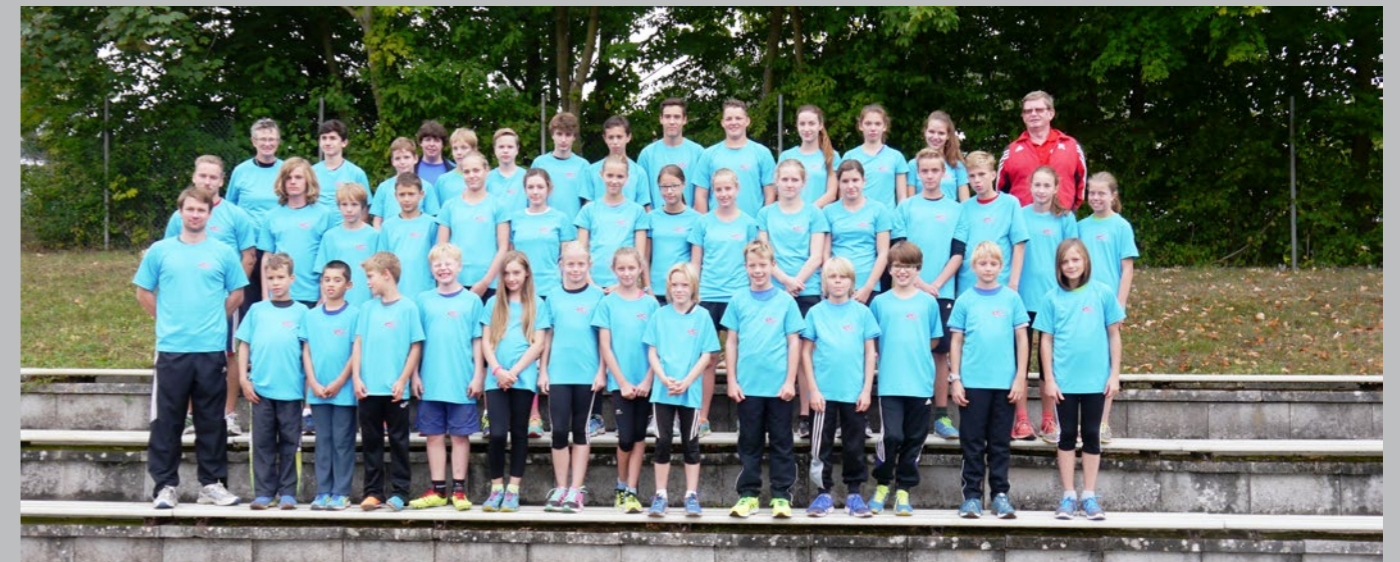
Team Vergleichskampf der Leichtathletik-Kreise