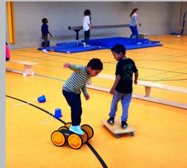
4. Spiele-Nachmittag des Kinderschutzbundes mit Unterstützung der TSG