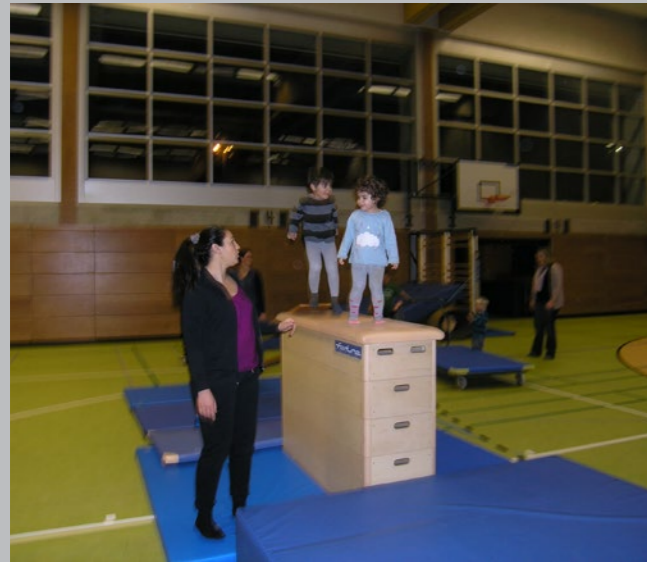
Bei den Turnermäusen sind Flüchtlinge herzlich willkommen.