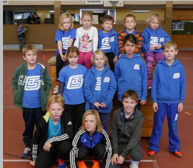
Hallenkinderturnfest - Leichtathleten