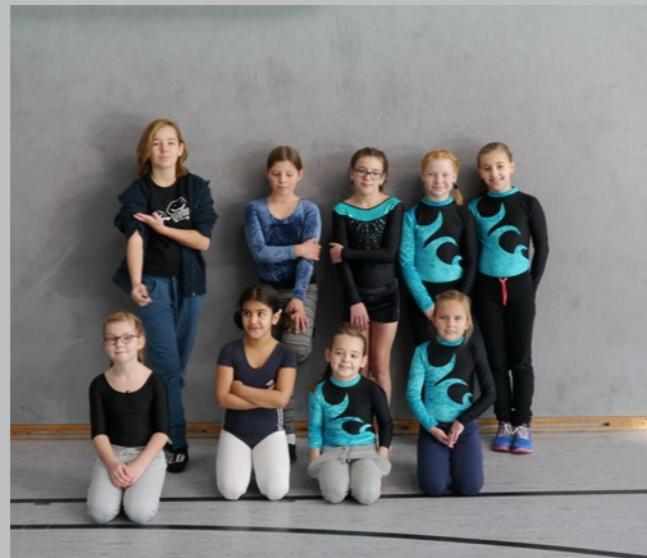
Turnerinnen beim Hallenkinderturnfest