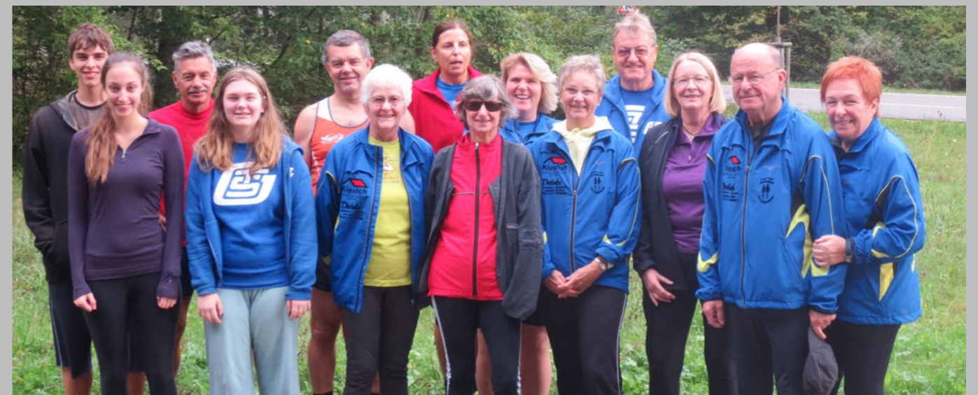
Teilnehmer des Lauf- und Walkingabzeichens