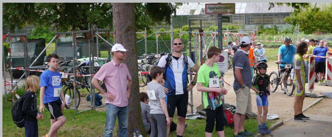
Teilnahme am Vincenz-Triathlon