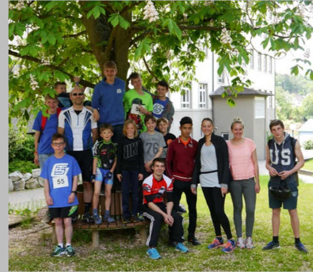
Mannschaft der TSG beim Vincenz-Triathlon