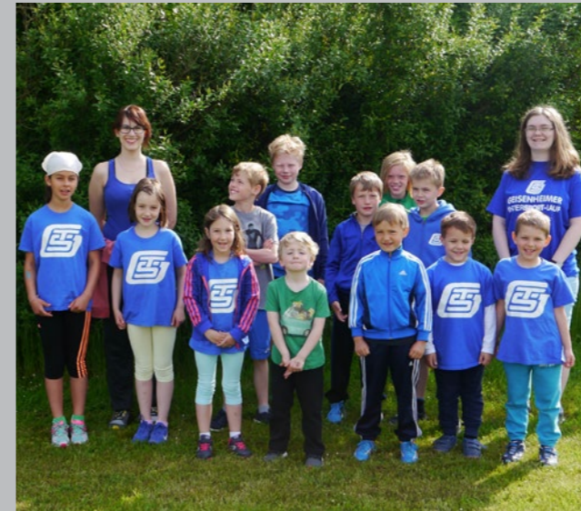
Team der TSG beim Gaumehrkampf