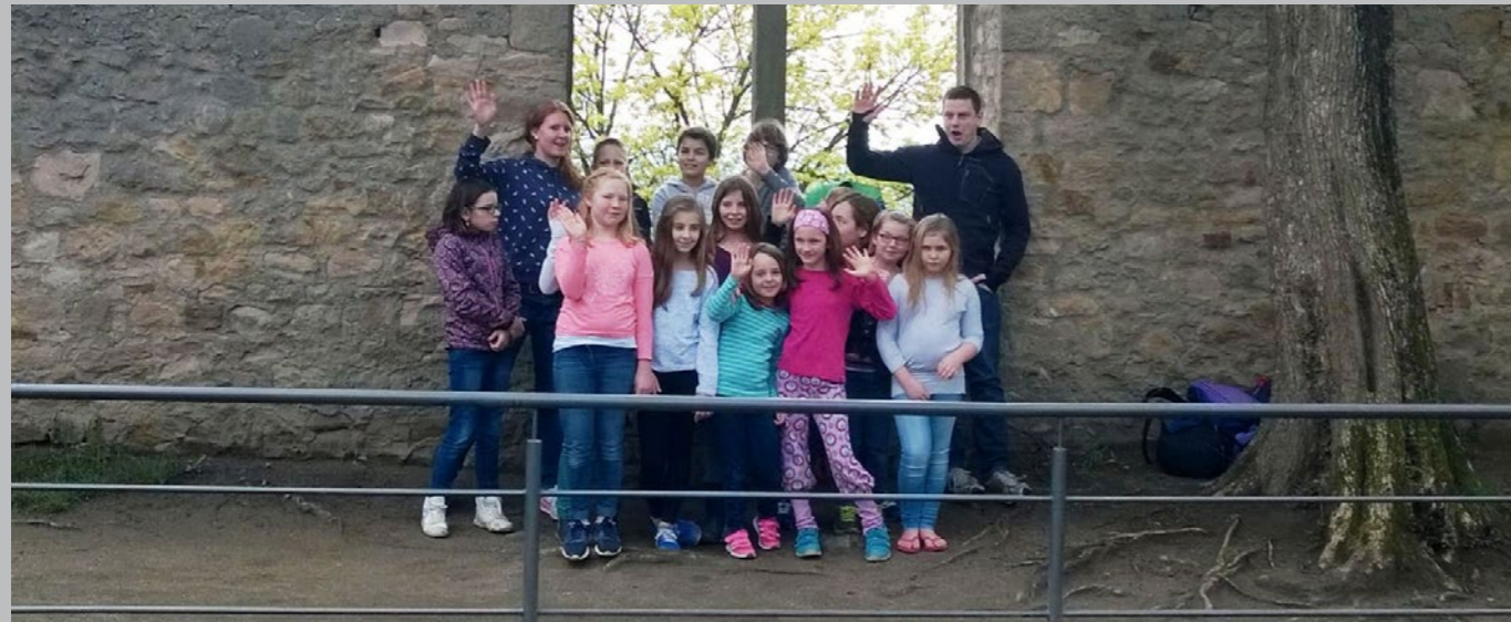
Turnergruppe auf Ausflug

in Teamarbeit gelöst werden. Ein Ei sollte nur mit Klebeband und Strohhalmen so geschützt werden, dass es im anschließenden Versuch, vom Burgturm geworfen zu werden, nicht kaputt geht. Wie baut man aus Zeitungspapier und Schaschlickspießen eine Marmorbahn? Und wie kann man eine Brücke aus Zeitungspapier und Klebeband bauen, die stabil genug ist, dass ein ferngesteuertes Polizeiauto darüber flitzen kann? Gar nicht so einfach!