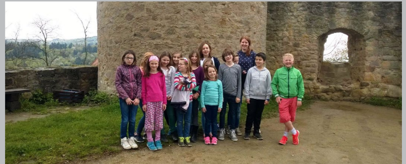
Starke Kinder und Jugendliche auf der Starkenburg