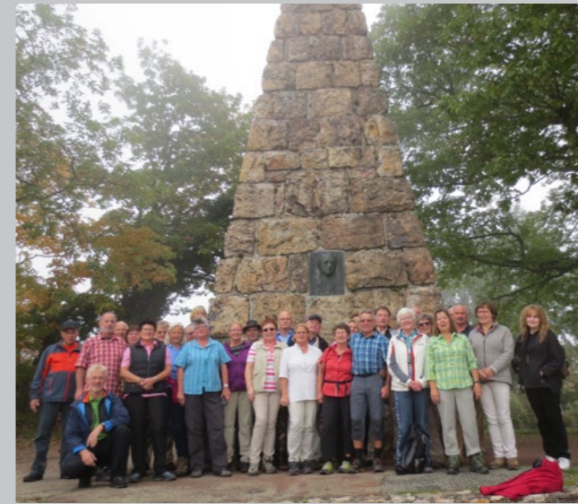
Herbstwanderung des Lauf- und Walkingtreffs