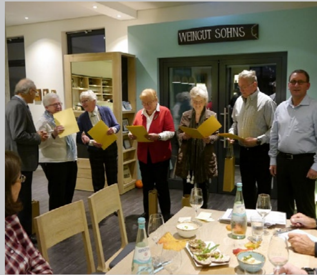
50 Jahre TSG