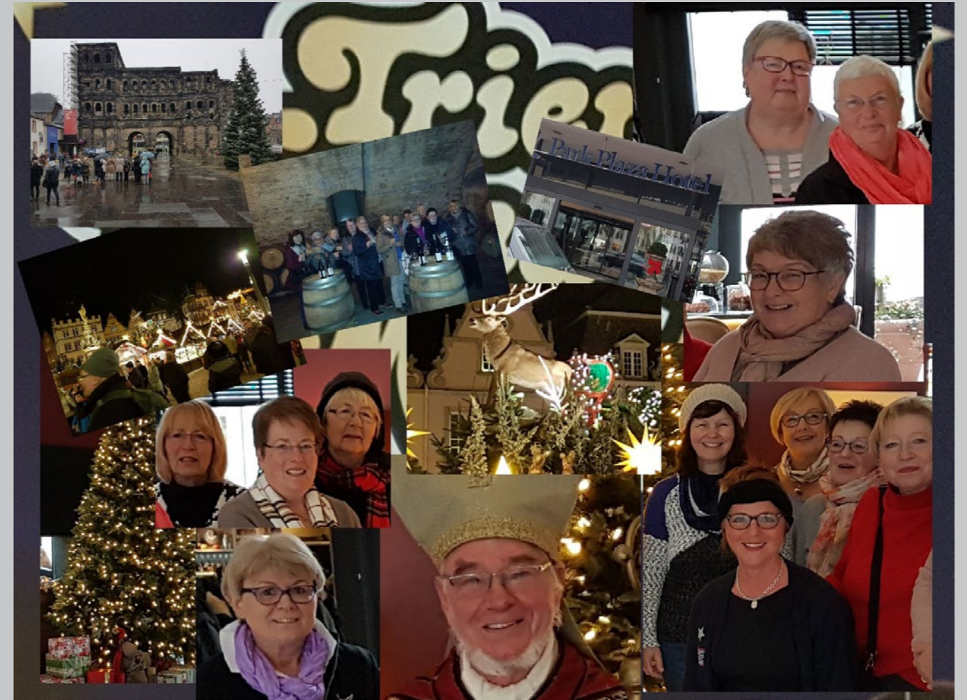
Ein gelungener Ausflug nach Trier

Weitere Infos und Datenschutzhinweise finden Sie auf unserer Webseite. www.rheingau-apotheke.de