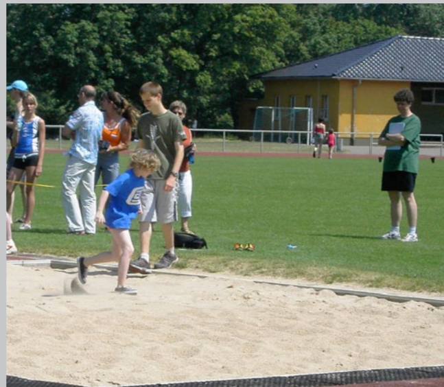
In der Kellersgrube