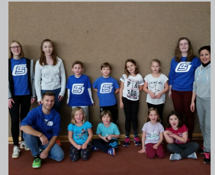
Das Geisenheimer Team