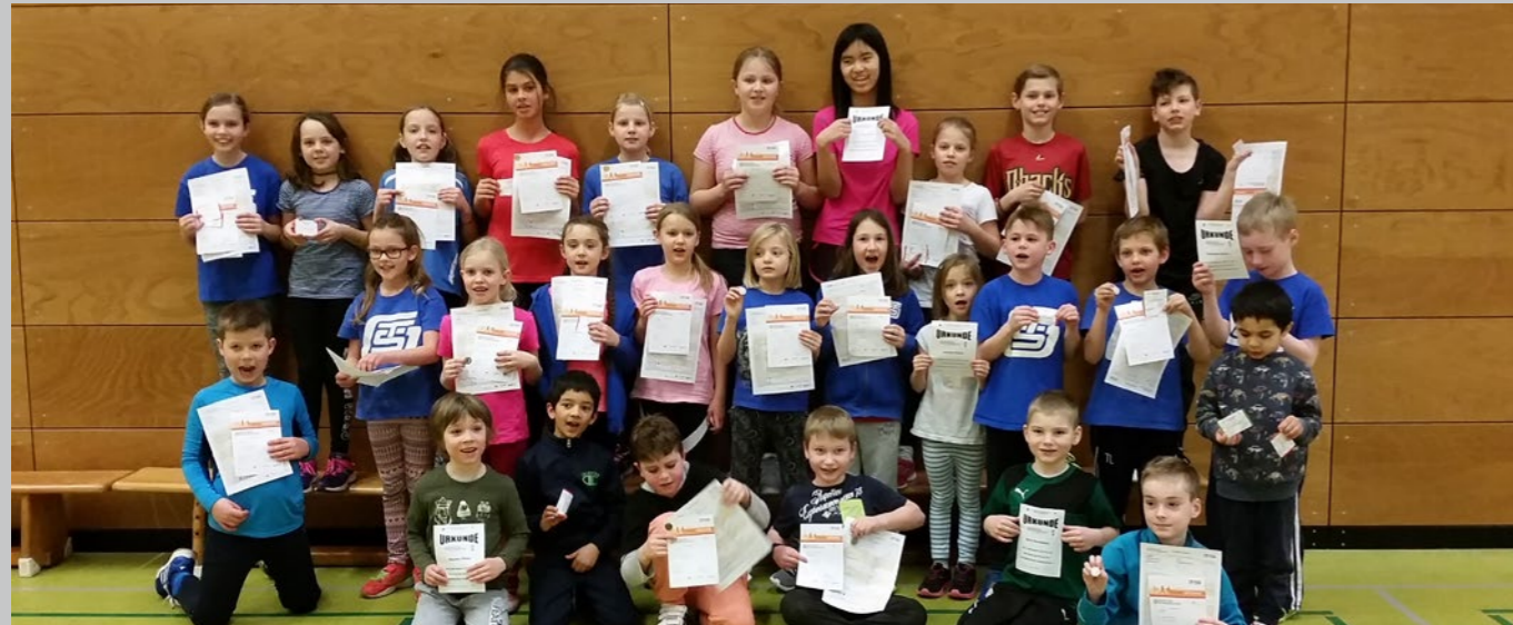
Sportabzeichen - Übergabe