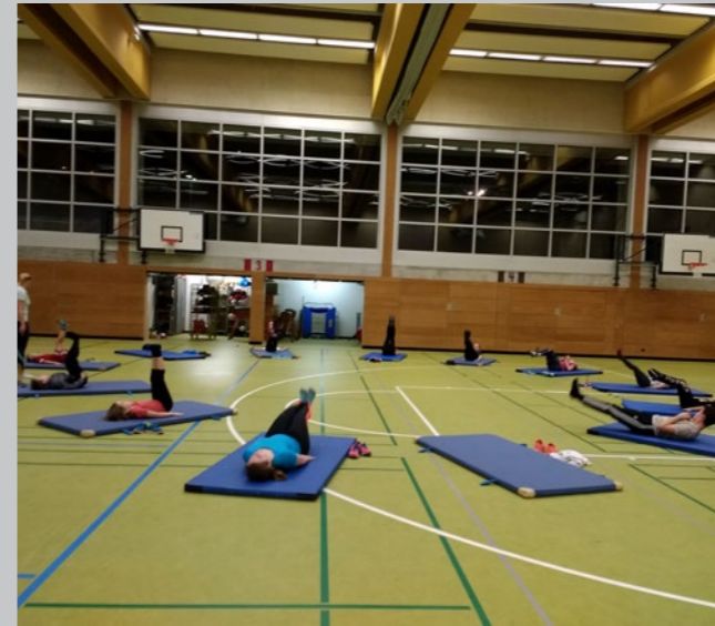
Beim Hallentraining Winter 2017