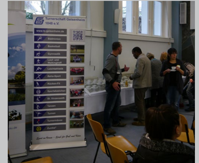
Mit Rollup und englischem Trainingsplan sowie Informationen zur Mitgliedschaft konnten die international Studierenden gut informiert werden.

Ziel des Projekts „Study & Work“ ist es, ausländische Absolventinnen und Absolventen als Fachkräfte in die deutsche Arbeitswelt zu integrieren. Beim 2. Runden Tisch des Projekts am Freitag, 10. November 2017, stand die Vernetzung der internationalen Geisenheimer Studierenden mit Partnern aus der Region auf der Agenda. Als regionale Partner konnten sich die verschiedenen Geisenheimer Vereine präsentieren und ihr Angebot vor-