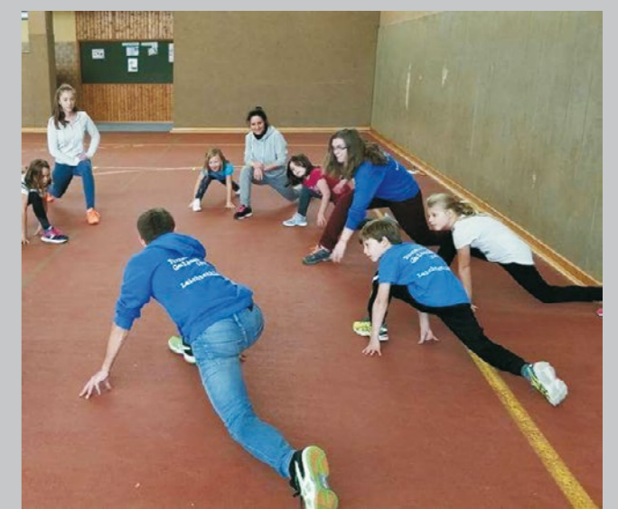
Dehnübungen im Training