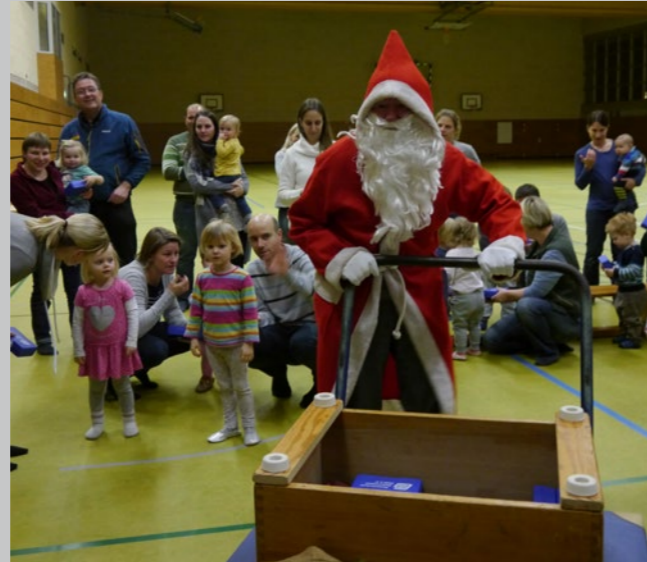
Der Weihnachtsmann bei den Turnermäusen