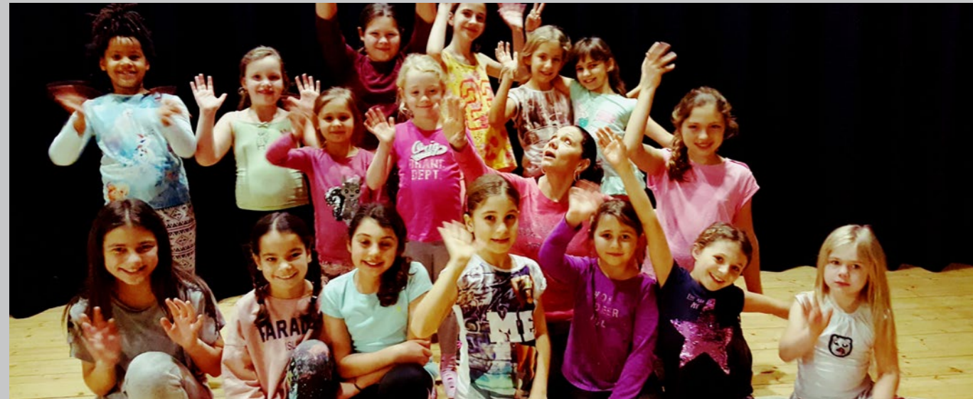
Geisenheimer Latin Kids