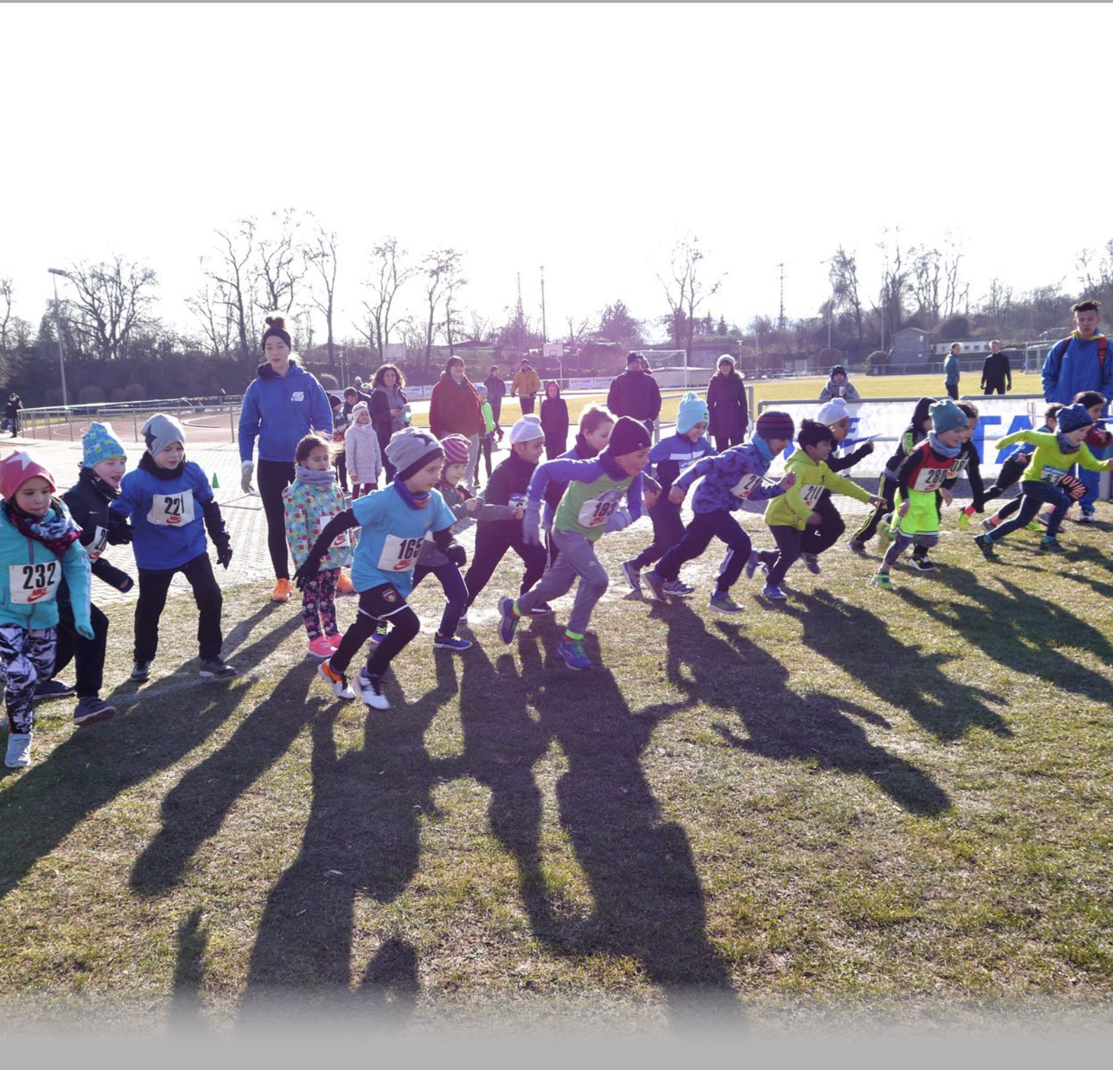
Bambini-Lauf beim Kreiscross

Vereinsnachrichten der Turnerschaft Geisenheim 1848 e.V.