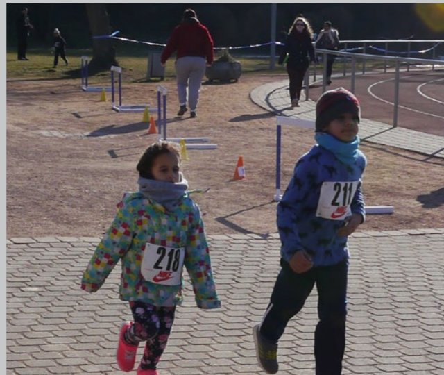
Lauf der Bambinis