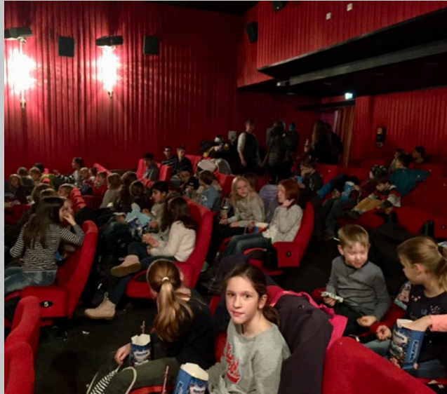
Fack ju Göhte 3 im Geisenheimer Kino