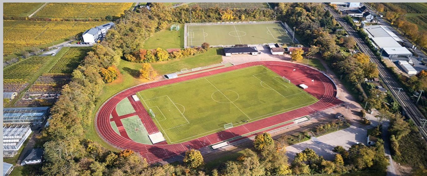
Luftbild Kellersgrube