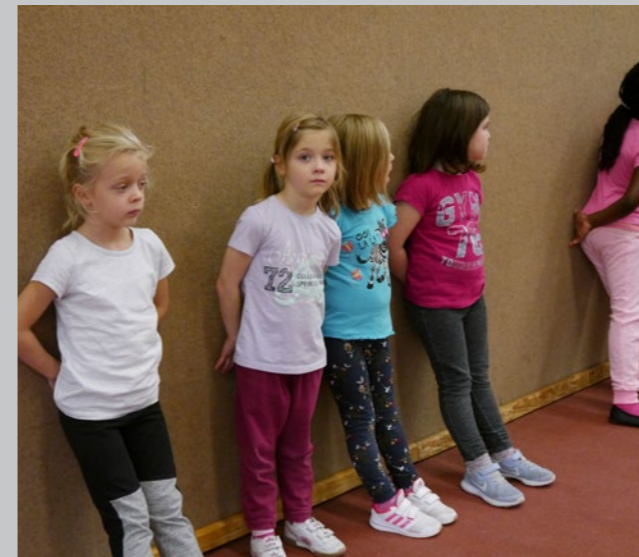
Warten auf den nächsten Wettkampf