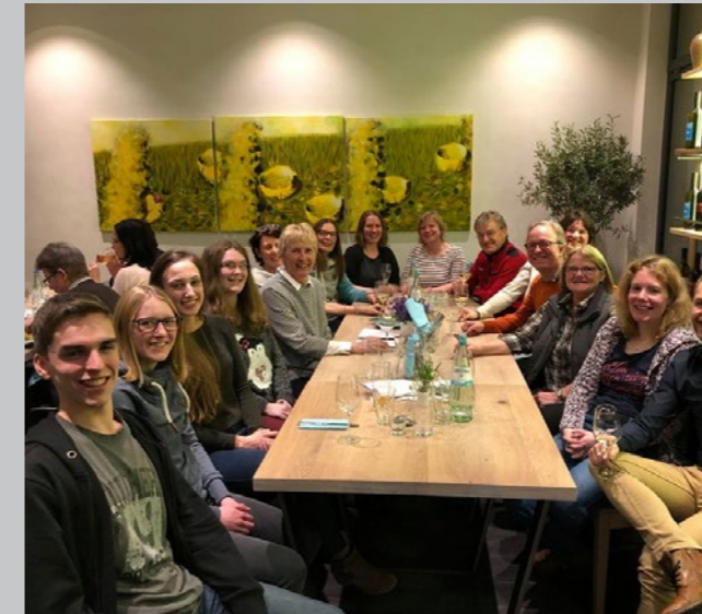
Sportabzeichenübergabe der 18+ jährigen