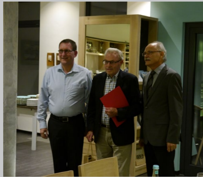
75 Jahre TSG