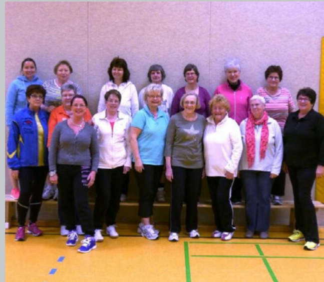
Die Mittwochsfrauen - Gruppe