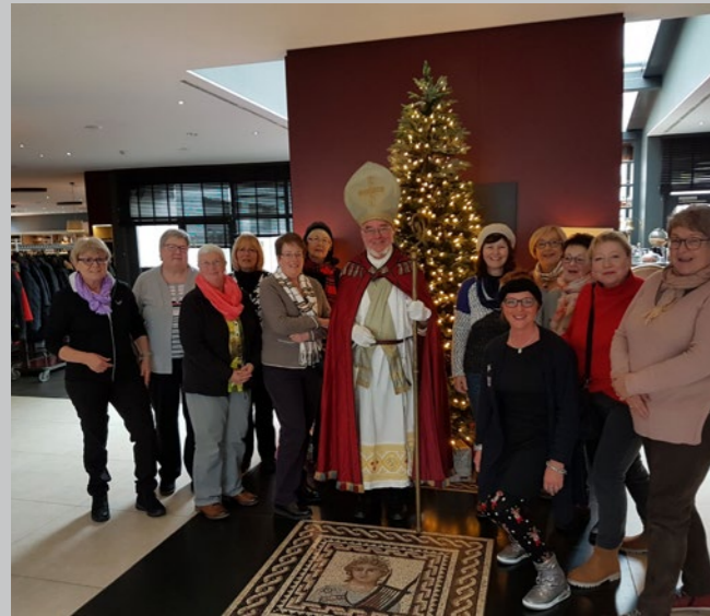
Besuch des Nikolaus