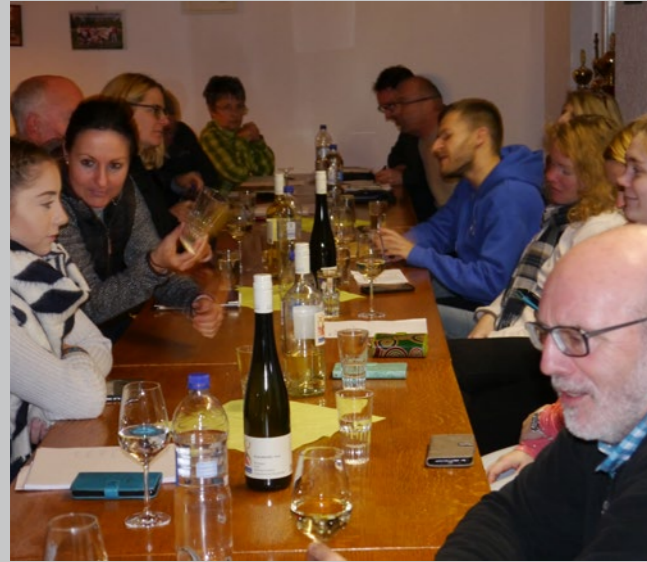
Viele ÜbungsleiterInnen hatten teilgenommen