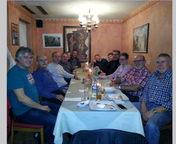
Treffen beim Griechen