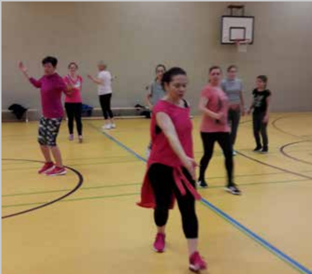
Die Zumba®-Gruppe der TSG