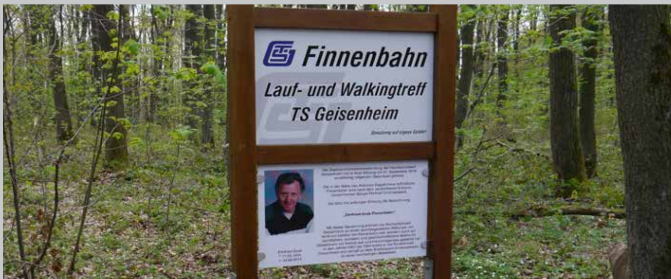
Das neue Schild an der Finnenbahn, Antoniuskapelle Marienthal