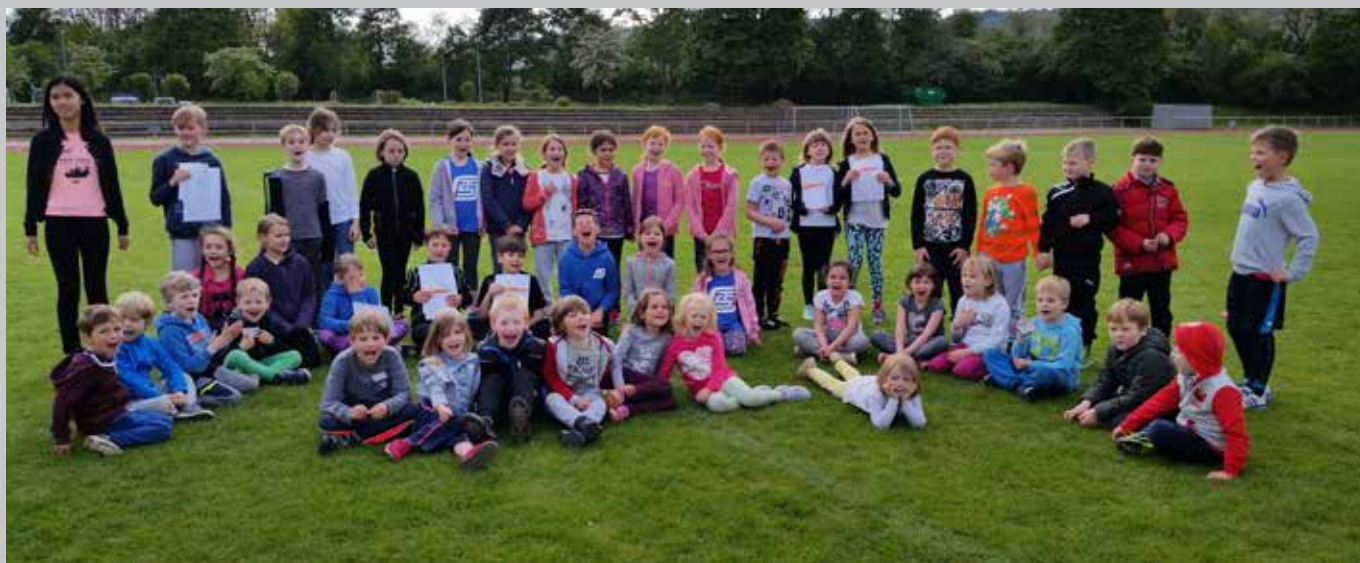
Erfolgreiche Sport- und Laufabzeichenteilnehmer