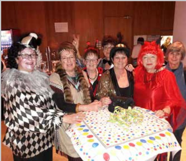
Die Mittwochsfrauen an Fastnacht