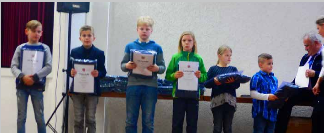
Erfolgreiche Sportler bei der Ehrung der Stadt Geisenheim