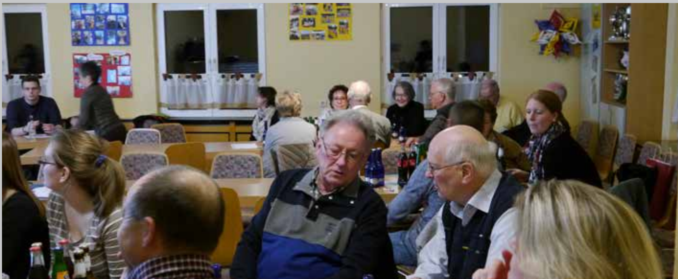
Einige Mitglieder der TSG waren zur Mitgliederversammlung gekommen