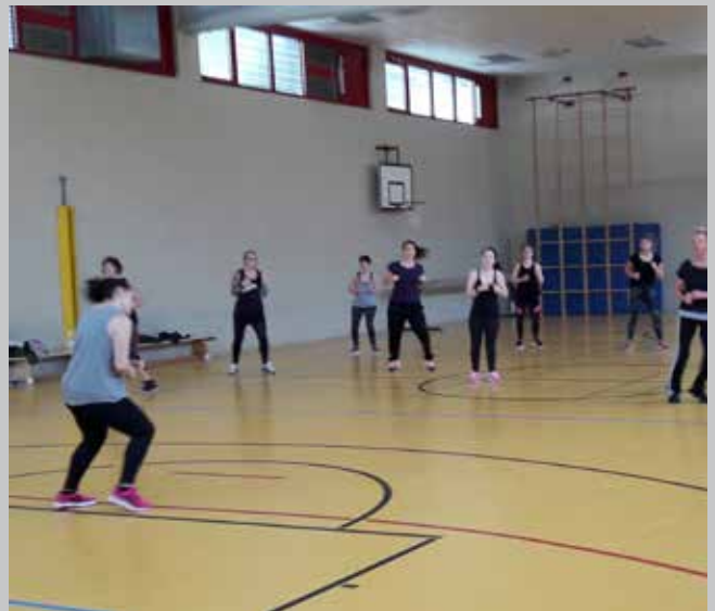
Schnupperkurs Tae Bo