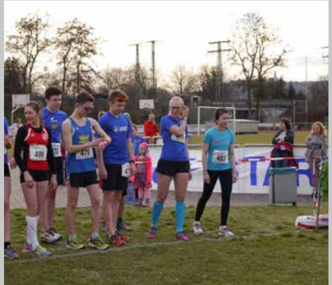
Kurz vor dem Start