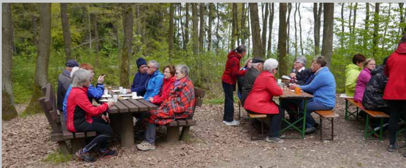
Lauf in den Frühling