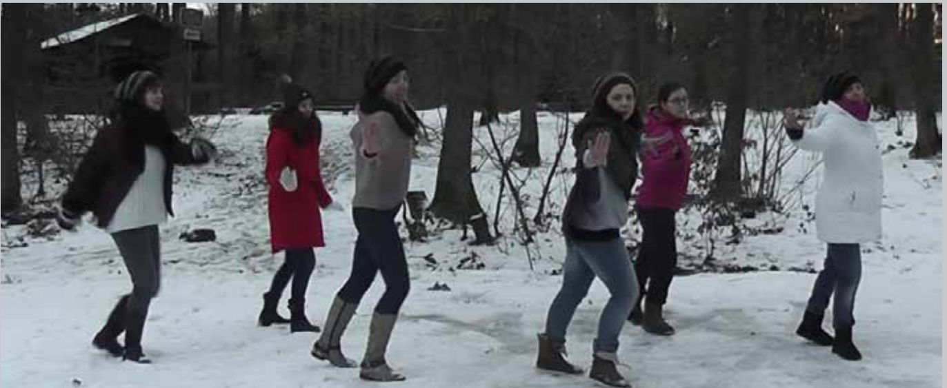
Zumba im Schnee am Antoniuskapellchen

Wie würdest Du Deinen Zumba®-Kurs beschreiben?