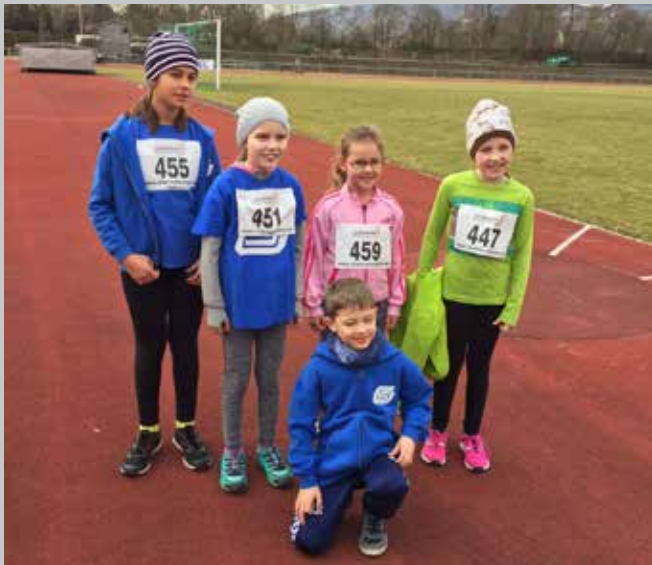
Das Geisenheimer Kinder-Team